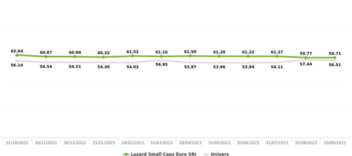
Evolution du score ESG

L'univers ESG de référence du portefeuille est : L'univers actions de la zone Euro fourni par nos partenaires ESG, dont les capitalisations boursières sont comprises entre cent millions et