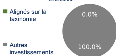
1. Alignement des investissements sur la taxinomie, obligations souveraines incluses*