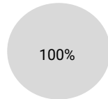
2. Alignement à la taxinomie des investissements hors obligations souveraines *

■ Alignés à la Taxinomie ■ Autres investissements