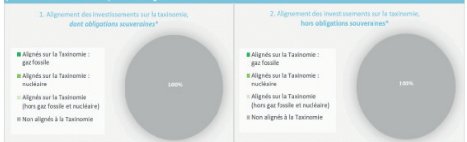
Ce graphique représente 100% des investissements totaux.

Les deux graphiques ci-dessous font apparaître en vert le pourcentage minimal d'investissements alignés sur la taxinomie de l'UE. Étant donné qu'il n'existe pas de méthodologie appropriée pour déterminer l'alignement des obligations souveraines* sur la taxinomie, le premier graphique montre l'alignement sur la taxinomie par rapport à tous les investissements du produit financier, y compris les obligations souveraines, tandis que le deuxième graphique représente l'alignement sur la taxinomie uniquement par rapport aux investissements du produit financier autres que les obligations souveraines.