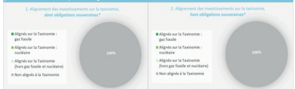
Ce graphique représente 100% des investissements totaux.

Les deux graphiques ci-dessous font apparaître en vert le pourcentage minimal d'investissements alignés sur la taxinomie de l'UE. Étant donné qu'il n'existe pas de méthodologie appropriée pour déterminer l'alignement des obligations souveraines* sur la taxinomie, le premier graphique montre l'alignement sur la taxinomie par rapport à tous les investissements du produit financier, y compris les obligations souveraines, tandis que le deuxième graphique représente l'alignement sur la taxinomie uniquement par rapport aux investissements du produit financier autres que les obligations souveraines.