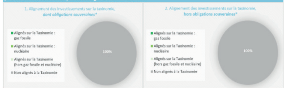
Ce graphique représente 100% des investissements totaux.

Les deux graphiques ci-dessous font apparaître en vert le pourcentage minimal d'investissements alignés sur la taxinomie de l'UE. Étant donné qu'il n'existe pas de méthodologie appropriée pour déterminer l'alignement des obligations souveraines* sur la taxinomie, le premier graphique montre l'alignement sur la taxinomie par rapport à tous les investissements du produit financier, y compris les obligations souveraines, tandis que le deuxième graphique représente l'alignement sur la taxinomie uniquement par rapport aux investissements du produit financier autres que les obligations souveraines.