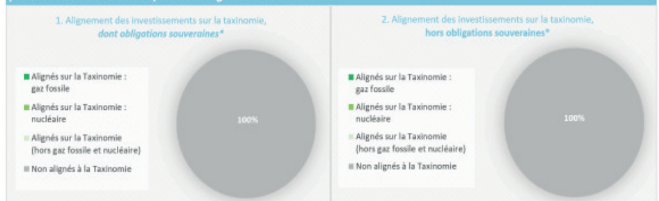
Ce graphique représente 100% des investissements totaux.

Les deux graphiques ci-dessous font apparaître en vert le pourcentage minimal d'investissements alignés sur la taxinomie de l'UE. Étant donné qu'il n'existe pas de méthodologie appropriée pour déterminer l'alignement des obligations souveraines* sur la taxinomie, le premier graphique montre l'alignement sur la taxinomie par rapport à tous les investissements du produit financier, y compris les obligations souveraines, tandis que le deuxième graphique représente l'alignement sur la taxinomie uniquement par rapport aux investissements du produit financier autres que les obligations souveraines.